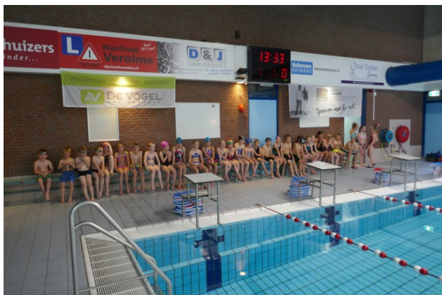
Swimm-in voor adspirant zwemmertjes

In 1988 kreeg De Schotejil het zwembad van de Staver als thuisbasis. In tegenstelling tot het oude bad beschikte de Staver over 4 banen van 25m. In dit bad wordt sinds die tijd 'door de weeks' nagenoeg dagelijks getraind en worden regelmatig officiële wedstrijden gezwommen.